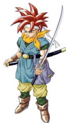
Figura 3: Chrono, arte de Akira Toriyama para o jogo Chrono Trigger

Quanto a Akira Toriyama, se tornou mundialmente famoso por mangás e séries animadas como Dragon Ball, sendo membro, juntamente com Hironobu Sakaguchi e Yuuji Horii, do chamado “Time dos Sonhos” da Square (hoje Square Enix), principalmente depois de games como Dragon Quest e Chrono Trigger. Além da consolidação de um modelo de gameplay em Chrono Trigger, o trabalho do artista consegue fixar na memória e no imaginário o que diferencia estes jogos dos outros, dado que estas informações essencialmente se processam de maneira visual. É pelo trabalho do artista, por exemplo, que se pode expandir o imaginário visual destes games a tal ponto que surgem bonecos, art books, filmes, entre outros. (in http://www.anime3000.com/information/creators/toriyama.html )