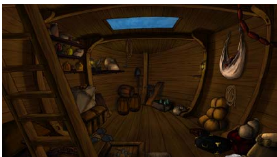
Figura 1: Cena do jogo “Búzios: Ecos da Liberdade”]

Por fim, a fase de produção e aplicação de nossos conhecimentos técnicos e criativos está em curso, e está sendo polida no processo. Fecha-se então o círculo de arte de McCloud: O “Búzios” é, sim uma manifestação artística tanto quanto educativa.